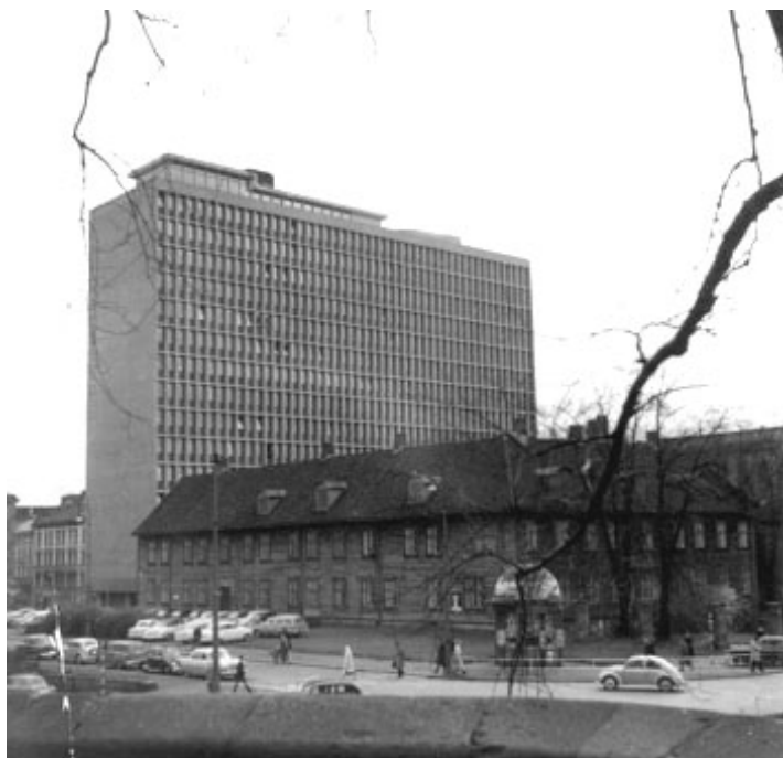
Høyblokken med Empirekvartalet, ca. 1960.

Regjeringskvartalet omfatter idag i hovedsak sju bygninger med beliggenhet sentralt i Oslo. Regjeringsbygg H-blokk (høyblokken) fra 1958 er regjeringskompleksets hovedbygg med sentral beliggenhet i regjeringsparken. Høyblokken er flankert av G-blokken fra 1915 (finansdepartementet) og Y-blokken fra 1970. S-blokken fra 1978 og R4 fra 1988 ligger i nabokvartalet mot øst (langs Grubbegata) og R5 fra 1996 er del av tilstøtende kvartal mot vest (langs Akersgata).