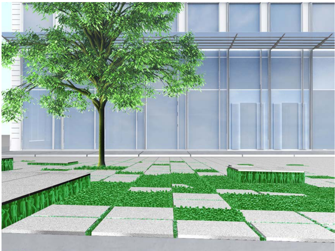
Do Ho Suh: Grass Roots Square , skisser 2009